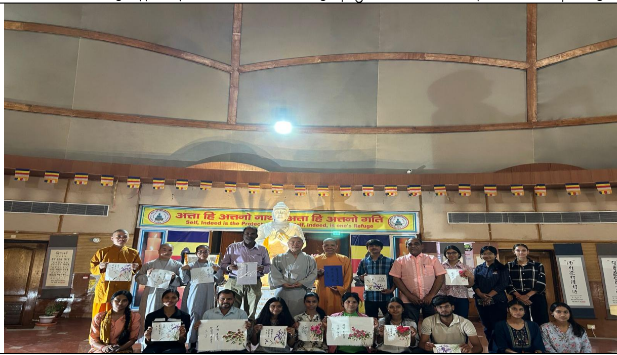
Students tried their hand at Siddham Calligraphy undr the guidance of Bhikshu Dowoong