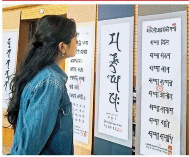
गौतमबुद्ध विश्वविद्यालय के ज्योतिबा फुले ध्यान केंद्र में लगी प्रदर्शनी देखती युवती 🌑

कहा, सिद्धं लिपि प्राचीन लेखन पद्धित है और यह मानवीय विकास की अभिव्यक्ति है